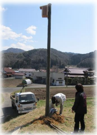
公民館からもよく見えるところに建っています。ゲググという鳴き声は早く聞こえないかと思えます。

そんなブッポウソウは田植えの頃に飛来して、9月頃まで産卵・子育てをおこないます。自分で巣を作ることができないので、木製の電信柱にキツツキが作った巣などを使って子育てをしています。コンクリートの柱に替わってからは、子育ても難しくなってきました。そこで、巣箱の設置をすることで、繁殖を助けていくようになりました。しかしブッポウソウは敏感な鳥で、巣箱を立てる場所も考えなければいけません。