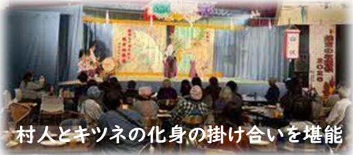
村人とキツネの化身の掛け合いを堪能