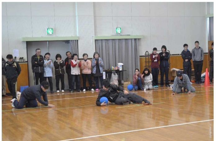
ゴールボール体験

平成29年2月12日(日)に「第11回銭宝冬季オリンピック」を行いました。雪が多く参加者が集まるか心配でしたが、小中高生の参加がたくさんあったこともあり63名集まりました。競技はカローリングとゲートボールの2種目と競技の間に邑南町がパラリンピックのフィンランドチームの合宿誘致をめざすゴールボールの体験を行いました。