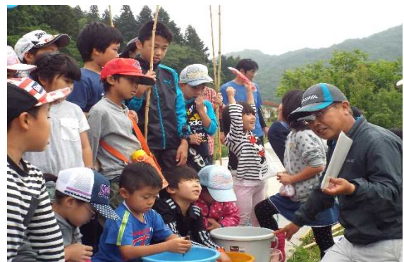
釣った魚の説明をしていただきました。