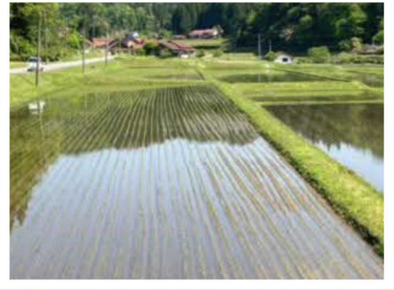
八色石の田園風景