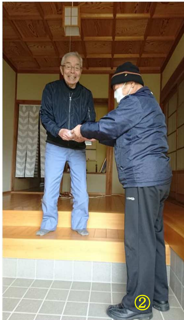
② 集落福祉員による もちの配達