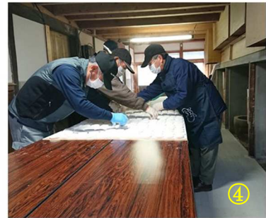
③ ④ 女性ボランティア、 地区社協役員による もちづくり