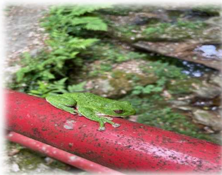
気持ちよさそうに昼寝をしていました。

先日赤馬滝に仕事で行った際に、滝の手前の橋で見慣れぬ大きなカエルが。近づいてみるとモリアオガエルでした。モリアオガエルは今が産卵の時期のようで、夜行性なので昼に見つけるのは難しいようです。準絶滅危惧種にも指定されており、私も野生のものを見るのは初めてでした。豊かな自然の中だからこそできる体験ですね。