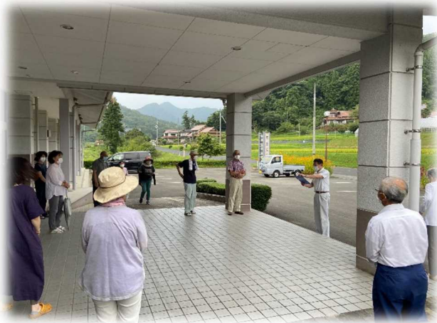
布施公民館へ避難した布施1集落の皆さん

令和2年8月23日（日）に銭宝自治会の避難訓練が行われました。朝9時に防災行政無線で避難訓練の放送を行い、各集落の班ごとに各集落の地域緊急避難場所等へ避難を行いました。今年は新型コロナウイルス対策として密回避のため公民館への一斉避難は行いませんでした。災害はいつ来るかわかりませんので、日ごろからこうして訓練や対策をしておくことが重要ですね。