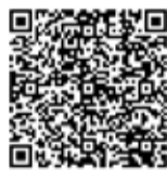
動画5地区全編 (34分31秒)

動画はYoutubeで「小さな拠点づくり」と検索、またはQRコードを読み込んでください!