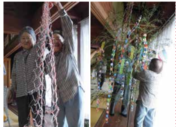
写真は7月3日に行われたサロンの様子。笹の葉に七夕飾りを作り、飾り付けました。