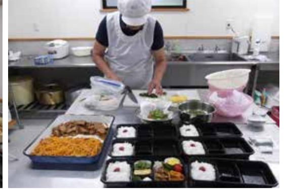
加工場は、惣菜と菓子製造の2部屋があります。菓子製造の部屋（写真左）は小さいですが、少人数で調理するには十分な広さです。