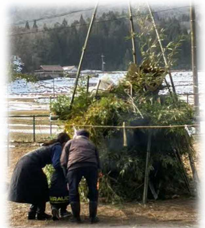
子ども会の皆さんによる点火