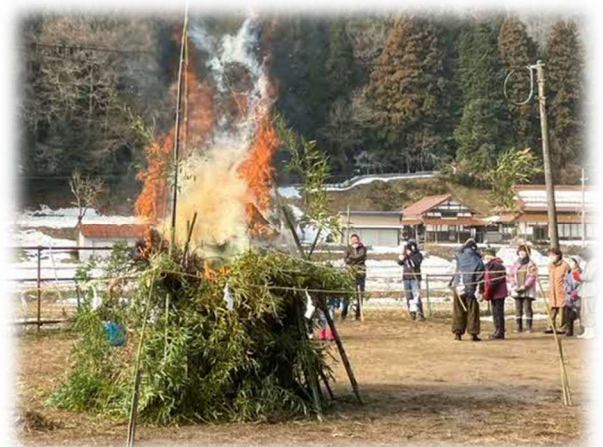
参加された皆さんが見守る中で、とんどが燃え上がり、皆さんの願いが昇天しました。