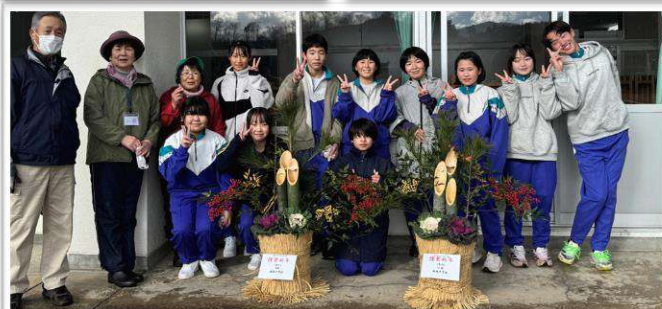
布施公民館の門松を作成した9班・10班の生徒のみなさん