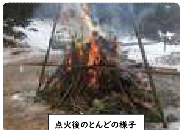
点火後のとんどの様子

「一年の計は元旦にあり」といいますが、多くの方々と『つながり合って』幸多き年となるように願っております。