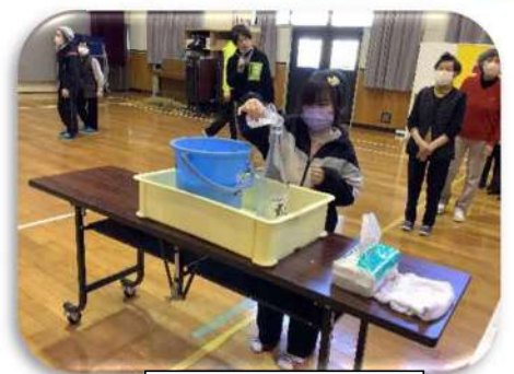
ジュースをどうぞ